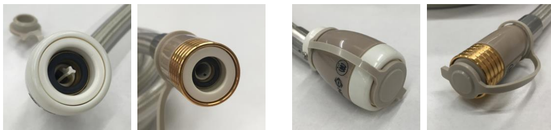
ガスコードの接続面

接続部にゴミが入り込まないように、使用しないときは付属のキャップをかぶせてください。暖房シーズンが終了し倉庫等に保管する場合も必ずキャップをかぶせてください。